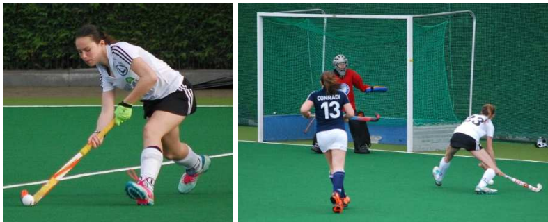
Hinten sicher, vorne entschlossen: Der Sieger stand schnell fest.