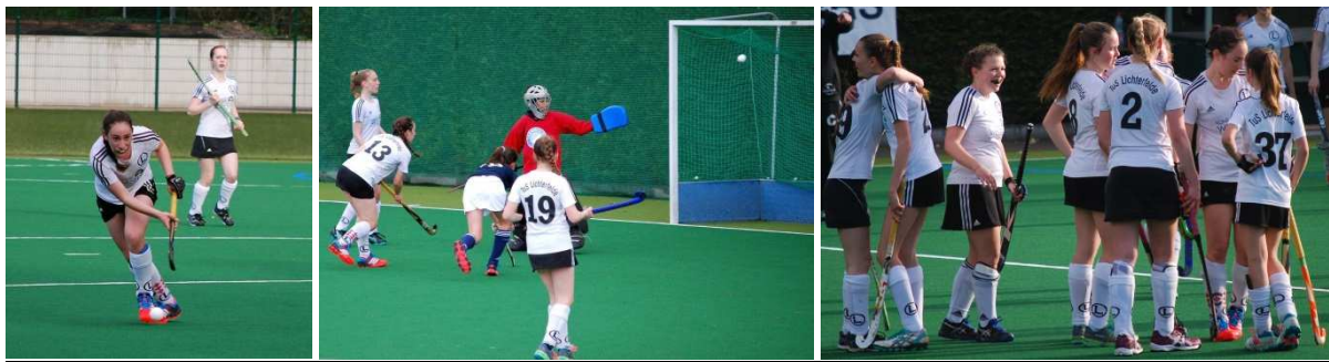
Spiel auf ein Tor: TuS Li überrollt Blau-Weiß beim Saisonstart und übernimmt die Tabellenführung.