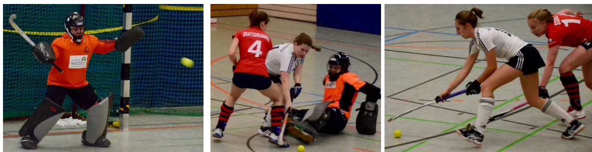
Im Spitzenspiel gegen den BHC gab es für TuSLi mit 1:4 den ersten Punktverlust in dieser Saison.