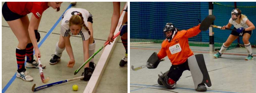
Energischer: Nach der Pause war das Spiel offen, aber es kippte nicht mehr.