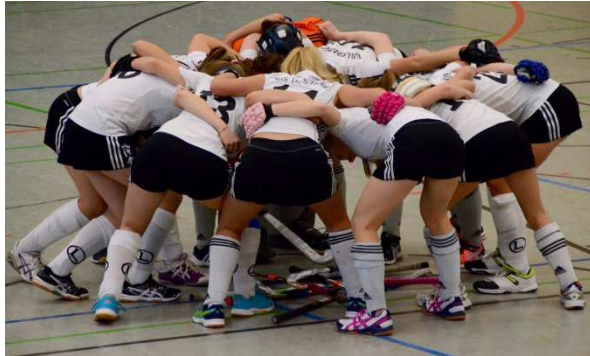
Luft nach oben: TuSLi kann es besser als diesmal.

Durch die Niederlage wird TuSLi den ersten Tabellenplatz nach der Vorrunde vermutlich an den BHC abgeben müssen, der noch ein Nachholspiel hat. Sollten beide Teams, wie zu erwarten, ihre restlichen Spiele gewinnen, stünde der BHC mit der derzeit deutlich besseren Tordifferenz dann wahrscheinlich auf dem ersten Platz. Für den Kampf um die Ostdeutsche Meisterschaft ist das nicht entscheidend, da beide Teams bereits sicher qualifiziert sind und dort als große Favoriten starten.